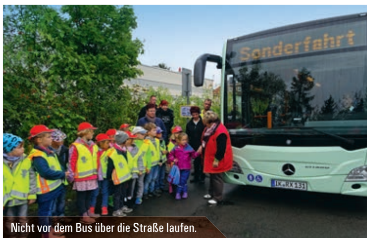
Nicht vor dem Bus über die Straße laufen.

Am Fahrradsimulator stehen die Erstklässler Schlange. Wer auf dem Rad sitzt, schaut auf einen Computerbildschirm, der ihn durch den virtuellen Straßenverkehr führt und mit Gefahrensituationen konfrontiert. Hier muss schnell und richtig gehandelt werden. Wer hat Vorfahrt? Auf