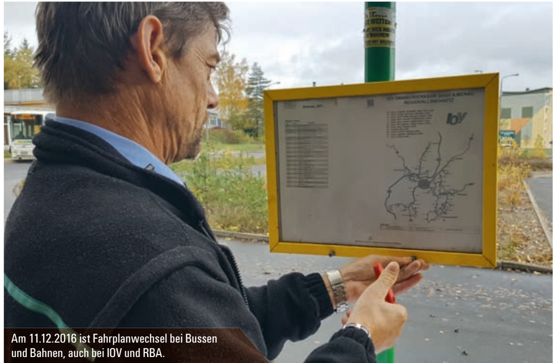
Am 11.12.2016 ist Fahrplanwechsel bei Bussen und Bahnen, auch bei IOV und RBA.

Es gibt eine große Ausnahme im Liniennetz der RBA. Wenn ab dem Frühjahr 2017 wieder umfangreiche Straßenbauarbeiten beginnen, dann treten Baufahrpläne in Kraft. Das betrifft im Wesentlichen in Arnstadt die Ichtershäuser Straße sowie eine Baustelle in Gräfenroda. Die Linienbusse