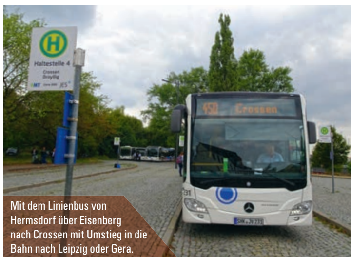
Mit dem Linienbus von Hermsdorf über Eisenberg nach Crossen mit Umstieg in die Bahn nach Leipzig oder Gera.

» Im Hauptlinien- netz der JES fahren die Busse jede Stunde dieselbe Runde. «